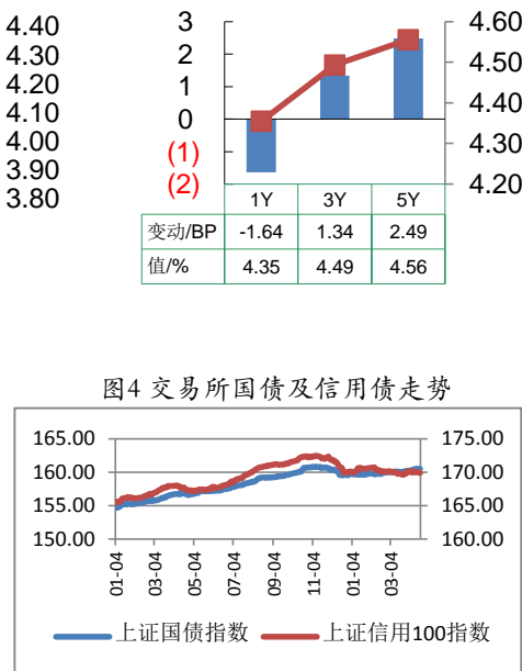
图4 交易所国债及信用债走势